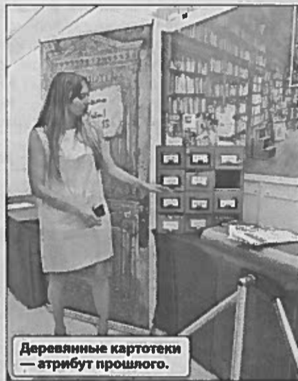
Деревянные картотеки — атрибут прошлого.

Интересными были выступления первого заместителя министра культуры России Владими-